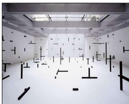
Esther Stocker, Installation, 2006

Le terme de musique minimaliste englobe un spectre assez large de styles, et se confond parfois avec la musique post-moderne. Les premières œuvres minimalistes utilisent effectivement un matériau assez dépouillé, avec l'utilisation de bourdons chez La Monte Young, ou des techniques de répétitions, par décalage de phase chez Steve Reich, ou par addition/soustraction de motifs chez Philip Glass. Les œuvres postérieures s'écartent en revanche de plus en plus d'une utilisation « minimale » du matériau musical, en particulier chez John Adams.