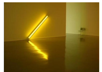
Dan Flavin, années 1960

Faites le test : www.quizz.biz/quizz-127330.html