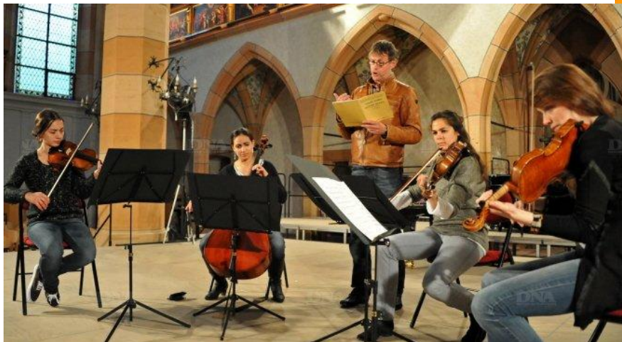
Different trains, 1988, à Saint-Mathieu de Colmar en 2014

Bien qu'ayant joué un rôle central dans l'évolution de la musique contemporaine, et, par ses œuvres, influencé des artistes au-delà de son champ de création, comme en musique électronique et en danse contemporaine