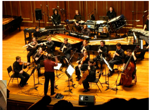
City Life, 1995

À partir de 1976, il développe une écriture musicale basée sur le rythme et la pulsation avec l'une de ses œuvres les plus importantes,