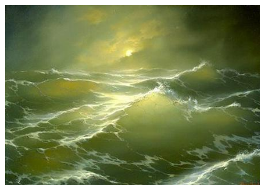
Clair de lune

Delacroix parlait de son art en termes élogieux et Turner le qualifia de génie.