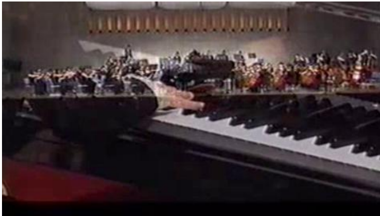
Concerto pour piano et orchestre, 1875

Tchaïkovski est un compositeur éclectique, il est l'auteur notamment de dix opéras, huit symphonies, quatre suites pour orchestre, cinq concertos, trois ballets, cent six mélodies et une centaine de pièces pour piano.