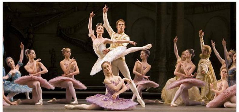
La Belle au Bois Dormant, 1889

Son œuvre, d'inspiration plus occidentale que celle de ses compatriotes contemporains, intègre des éléments occidentaux ou exotiques, mais ceux-ci sont additionnés à des mélodies folkloriques nationales.