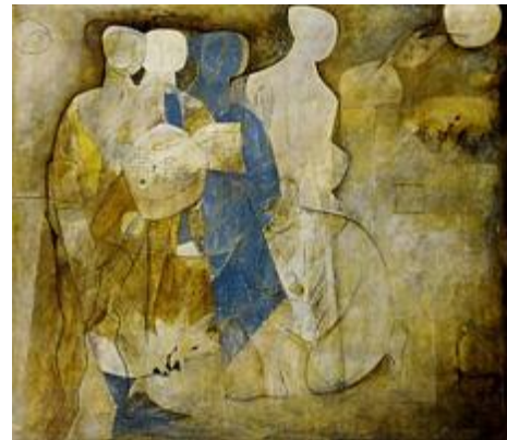
( Personnages , 1951)