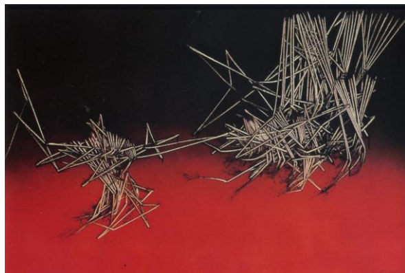
( Mariage , 1980)