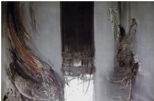
( Le triomphe de la mort , 1961)

En 1952, il enseigne le dessin à l'École d'Art de Gênes, parcourt les grandes villes, participe à différents concours, remporte des prix et devient rapidement une référence incontournable de l'art pictural au XX e siècle. Sa vie s'achève à Milan, le 28 novembre 1986.